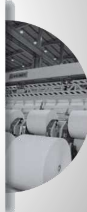
KAĞIT ENDÜSTRİSİ (PAPER INDUSTRY)