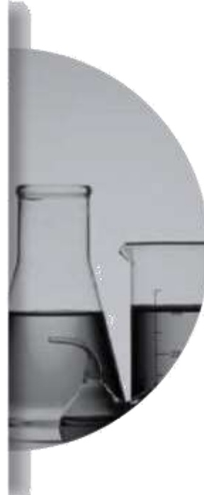
KİMYA ENDÜSTRİSİ (CHEMICAL INDUSTRY)