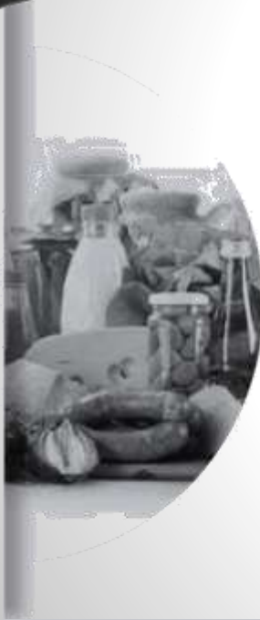
YİYECEK & İÇECEK ENDÜSTRİSİ (FOOD & BEVERAGE INDUSTRY)