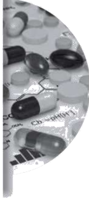
İLAÇ ENDÜSTRİSİ (PHARMACEUTICAL INDUSTRY)